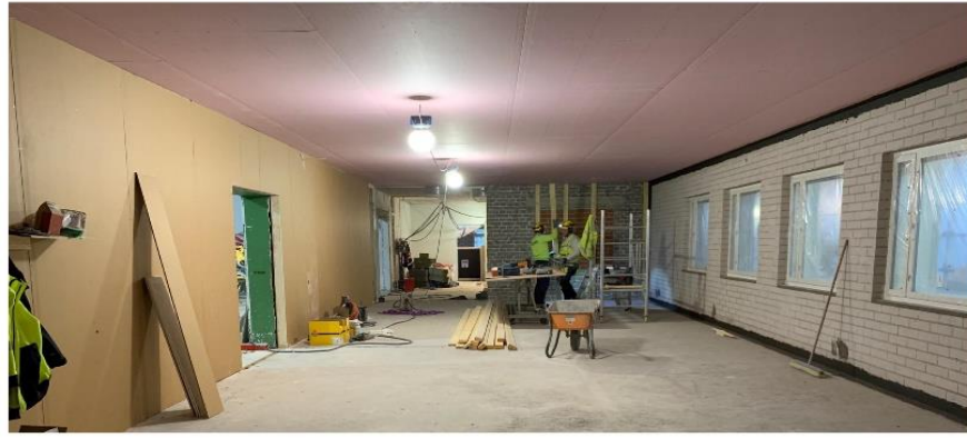
Kuva 2. Saneerausosan maalaustyöt