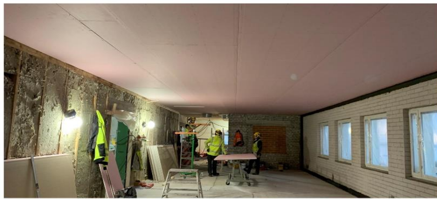
Kuva 1. Saneerausosan musiikkiluokan levytys