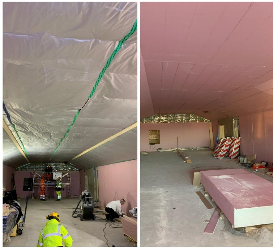
Kuva 4. Saneeraus, yläpohjan puhallusvilla